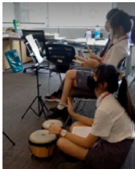
10年级练习Jing Ling创作的节奏。

学生们一直在学习使用作曲技巧（如一致，模仿和奥斯蒂纳托）来作曲节奏。学生们听到他们的作品现场播放，以决定他们作曲之旅的下一步。