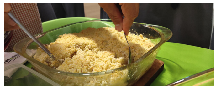
学生在团队建设 CCA 中制作苹果金宝