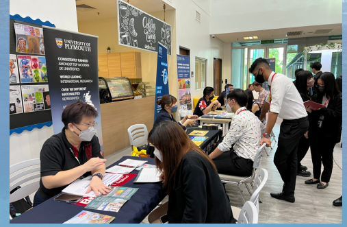
国际大学留学展览会