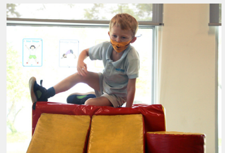
FS2学生在软游戏室和“建筑区”